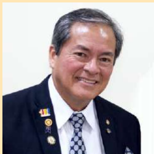
Fernando Aguirre Palacios Gobernador Distrito 4400 Rotary International