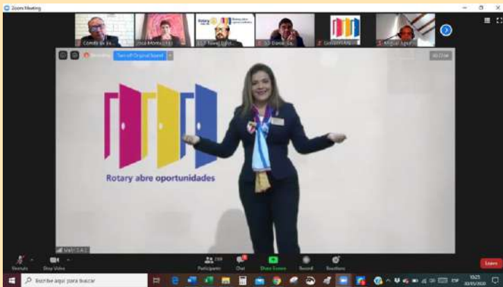
Presentación del logo oficial