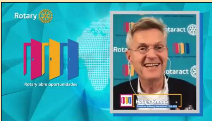
Presentación del Presidente de RI Holger Knaack .