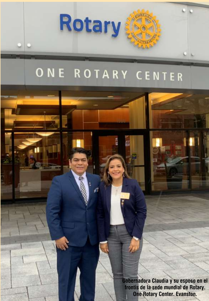
Gobernadora Claudia y su esposo en el frente de la sede mundial de Rotary. One Rotary Center. Evanston.