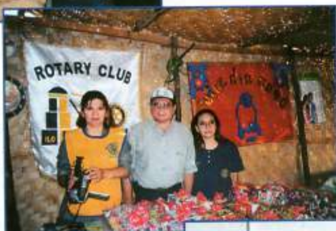
Venta anual de postres pro actividades de servicio en la comunidad