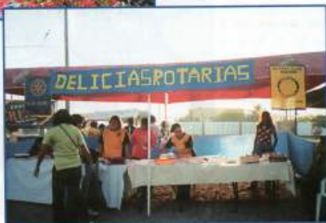
Trabajando con los comedores populares