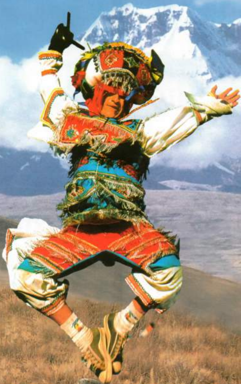
DANZANTE DE TIJERAS - PERU