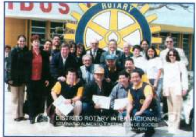
Los Rotarios de Huacho fueron los anfitriones de uno de los Cuatro Seminarios sobre Aumento y Retención de Socios que se realizaron en el D-4450