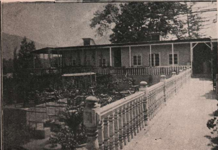
"Hotel Velásquez", alojamiento de los Delegados.

Quinta de "Los Limoneros". Uno de sus poéticos corredores.