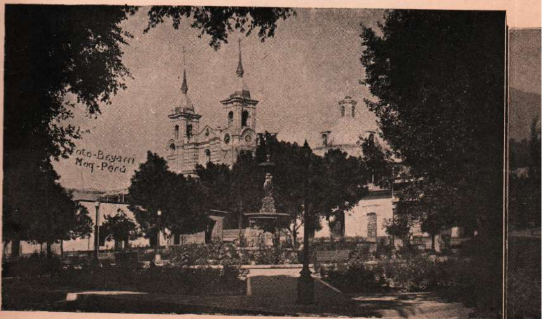
Plaza de Armas e Iglesia Parroquial.