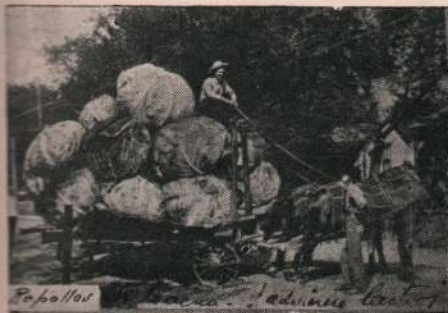
Repollos de Tacna.—¡Admírese lector!

Fácil adquisición de casas y quintas. — La ciudad cuenta también con hermosas quintas amplias, llenas de flores y frutos, verdaderas casas