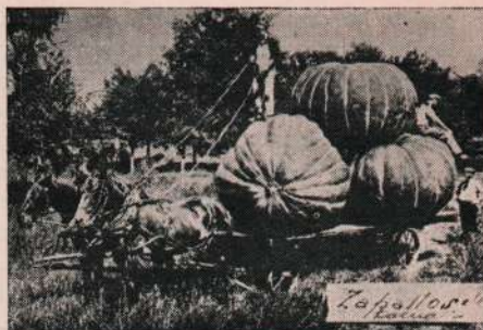
Zapallos de Tacna.

Instituciones sociales. —Las instituciones sociales son en primer lugar: el Club Unión, institución social de primera clase, con todo confort,