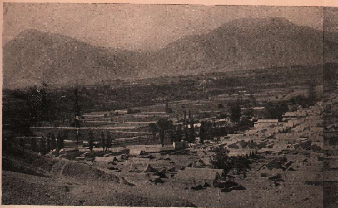
La Ciudad de Moquegua y su Campiña.