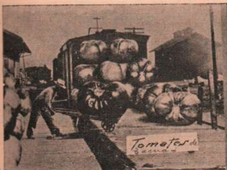
Tomates de Taena.

Taena, la ciudad del Caplina, como muy pocas ciudades de la República, reúne muchas condiciones ventajosas, para los turistas nacionales y extranjeros. Es verdad, que no encontrarán monumentos históricos y artísticos como los del Cuzco, ni suntuosos palacetes como los de Lima,