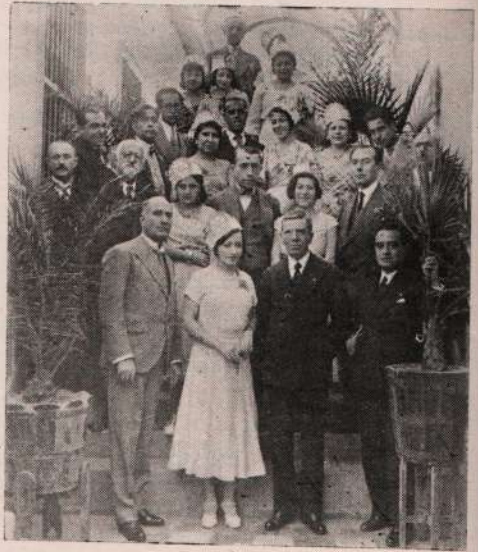
El Rotary Club de Moquegua con más de un 100% de asistencia, en su reunión del 29 de julio.

En la Plaza se encuentran: la Oficina de Correos y Telégrafos, que ocupa una casa particular; la Cárcel pública, edificio antiguo, de aspecto inquisitorial y descuidado, que no responde a ningún precepto humanitario y que, algunas veces, hubo de cerrarse por falta de presos; y el Club Social "Moquegua". En su lado N., puede contemplarse el alto muro exterior de la antigua y destruida Iglesia Matriz, muro que fué respetado por el terremoto del año 1868, y en el que está colocada una placa de bronce, homenaje de la juventud moqueguana, a la memoria del atrevido y glorioso avia-