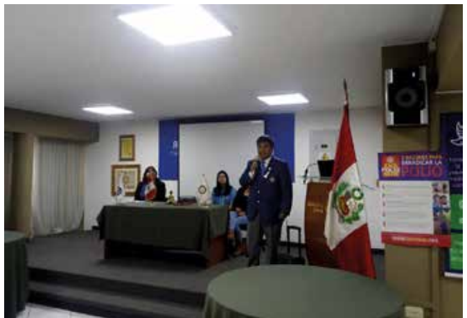
Asamblea Distrital de Interact