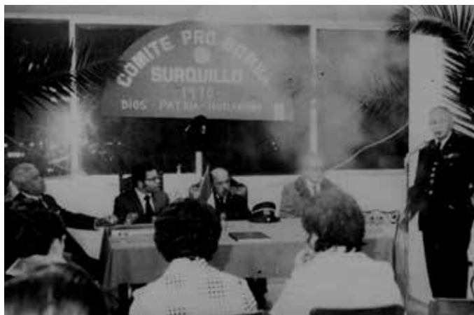
1971 / Cámara de Comercio de Surquillo.

Reunión Rotaria para creación de la Estación de Bomberos de Surquillo.