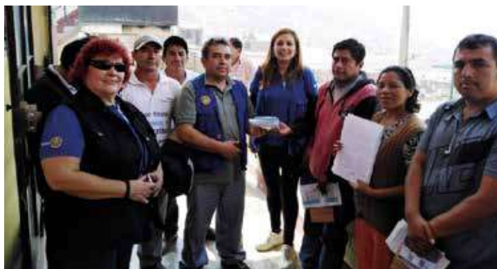
Entrega de 150 Becas EIGER a dirigente y directiva del Asentamiento humano Basilio Auqui