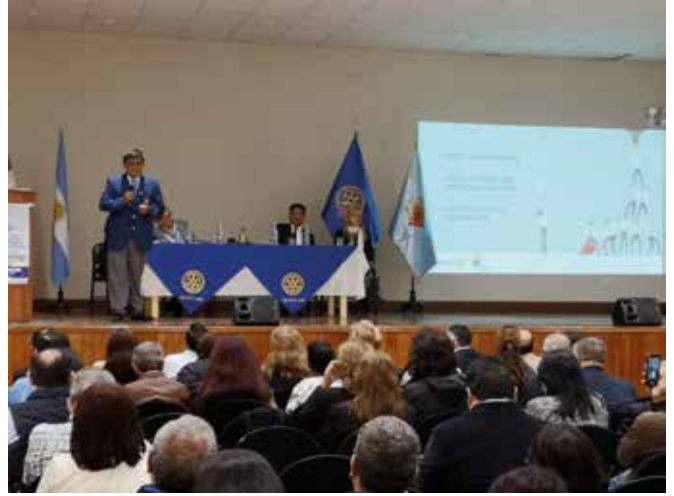
Asamblea Distrital 2019 - 2020