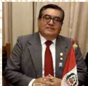
Róger Cueva Alcántara Gobernador del Distrito 4465-RI 2019/2020