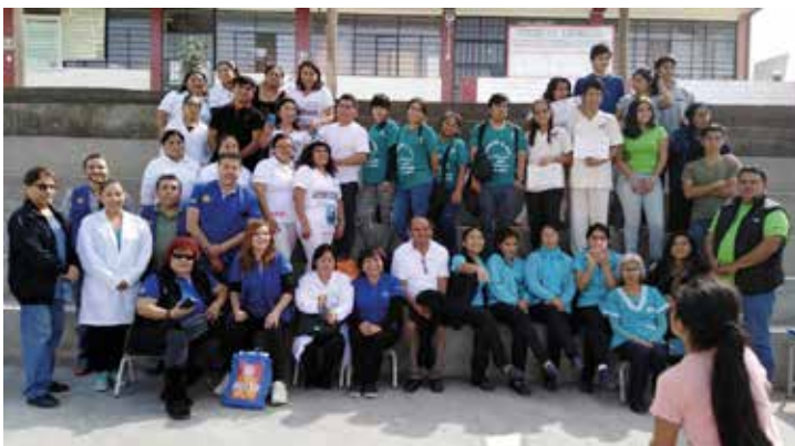
Equipo de Rotarios y Rotaractianos de Club Nuestra Señora de Gracia y voluntarios de la Escuela de posgrado de Universidad Norwer Wiener al concluir la Campaña de Salud y medica.