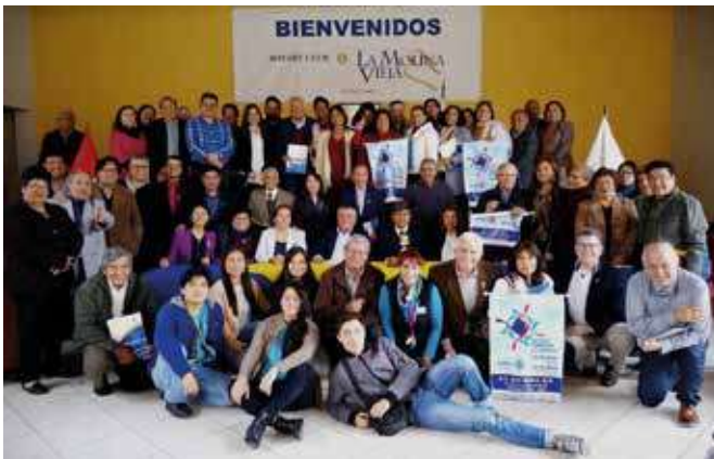
Primer Seminario de Gestión y Administración de Subvenciones