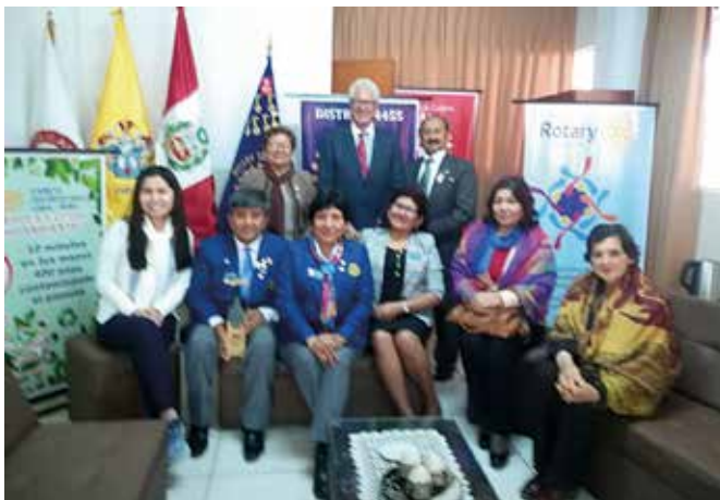
Visita al RC Cañete