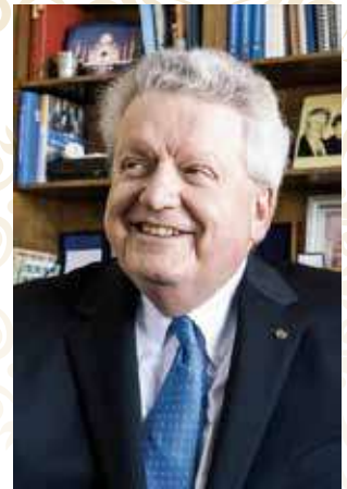
Presidente de Rotary International