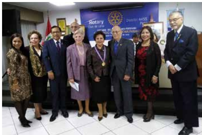
Directiva 2019-2020 del Rotary de Lima.