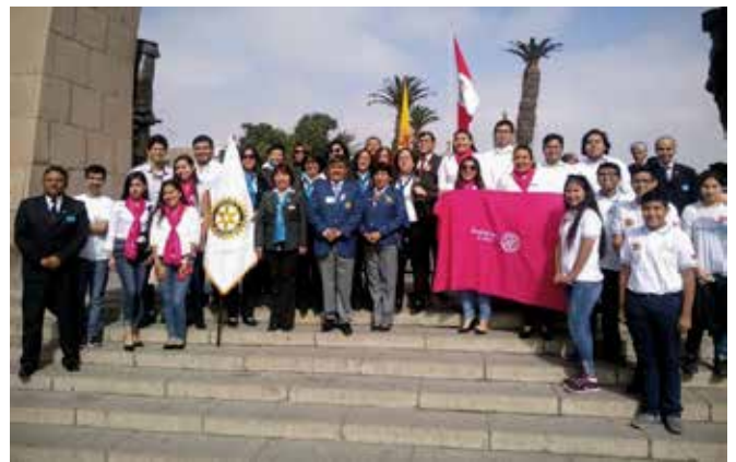
Visita a los Club Rotarios de Tacna